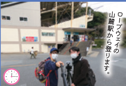
ロープウェイの 山麓駅から登ります。