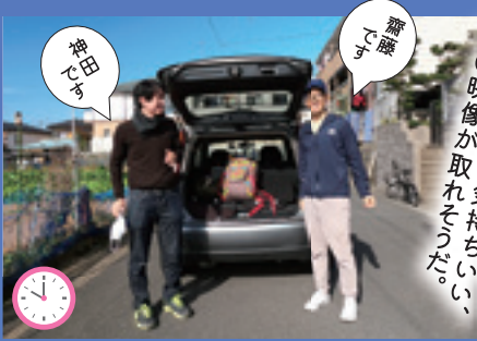
はあ、出発。 真っ青な空が気持ちいい、 いい映像が取れそうだ。

桜保険のHPの 動画第2作を作成中です。 その背景撮影のために 担当所員二人が11月に 鋸山取材をした様子 をご紹介します。