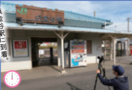
浜金谷駅に到着。 絵になりそうな 青い屋根がきれいな駅です。