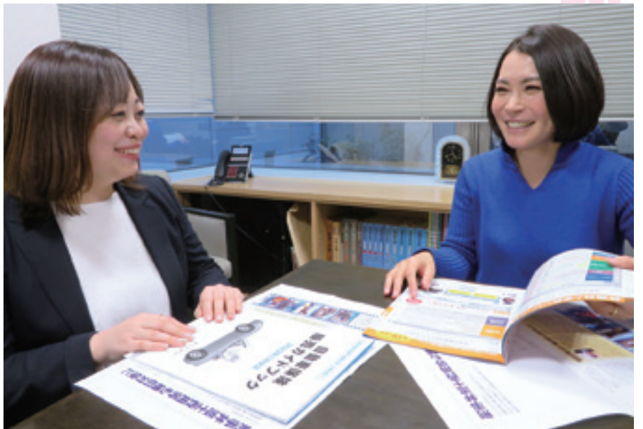
(写真撮影時のみマスクをはずしました)