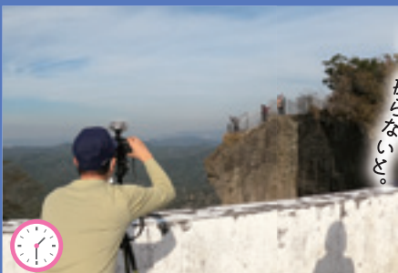
この風景は、鋸山の定番、 地獄のぞきだ。鋸山の定番、 上手く撮らないと。