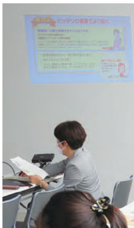
プロジェクターによる保険の説明風景

参加者の発言の冒頭に、桜保険事務所から小型のプロジェクターを使って自動車保険などの訴えをさせていただきました。