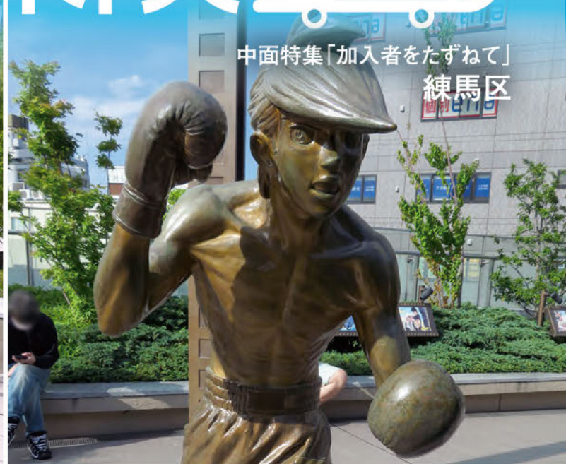
中面特集「加入者をたずねて」 練馬区