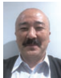
東京都障害児学校 教職員組合 書記長

昨年2月府中郷土の森公園に行った時の寒緋桜です。あれから1年人間はコロナに明け暮れた日々でしたが、桜は今年も元気に花を咲かせていることですよ。