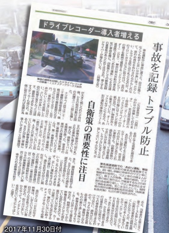
2017年11月30日付「東京新聞」